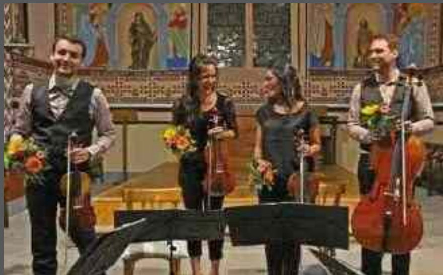
CONCERT EGLISE VIEUX BOURG «Quatuor Adastra», le 6 Août