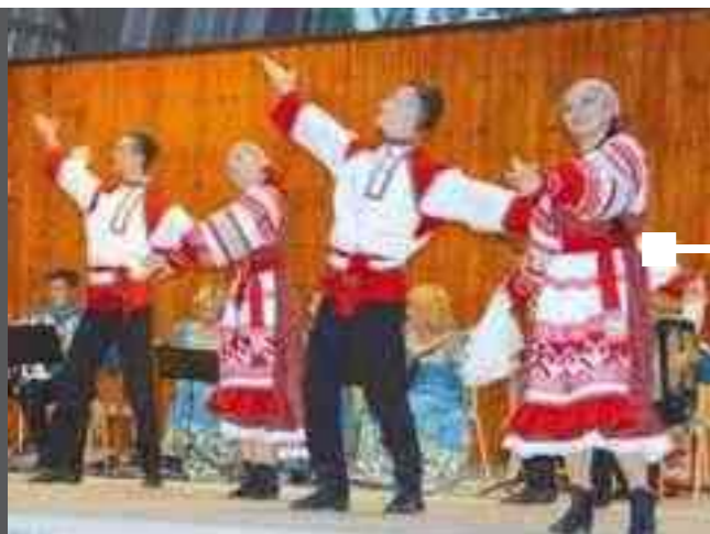
LE GROUPE « UZORI » Soirée organisée par la municipalité en collaboration avec le Festival de Gannat, le 21 Juillet