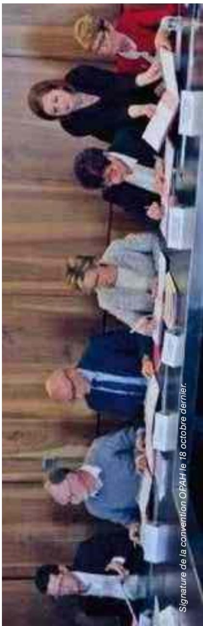
Signature de la convention OPAH le 18 octobre dernier.