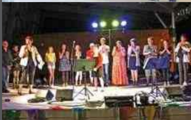
L'ELDORADO TOUR 2016 Etape du concours musical, le 29 juillet 2016