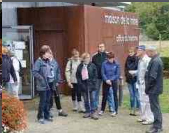
JOURNÉES DU PATRIMOINE Les 17 et 18 septembre